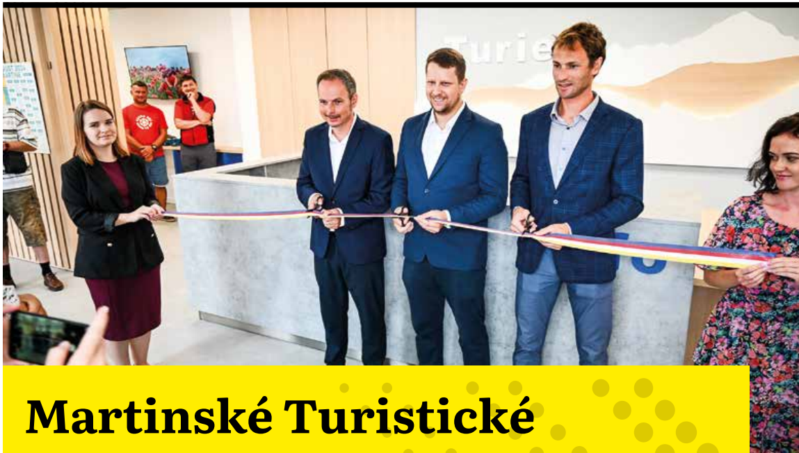
Momentka zo slávnostného otvorenia Turistického informačného centra.

bolo na očiach a ľahko identifikovateľné, avšak tie technické a technologické podmienky neboli udržateľné.“