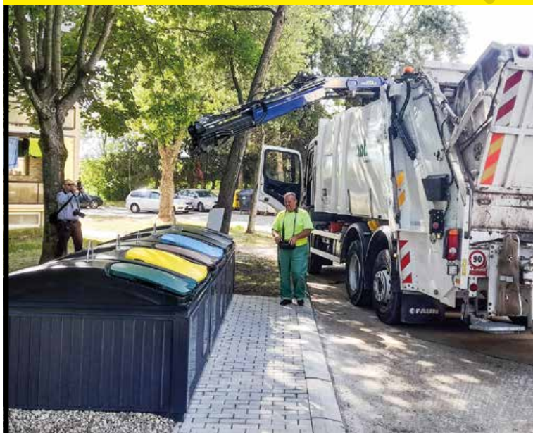
Nové stojisko polopodzemných kontajnerov na Kronerovej ulici. Zahŕňa kontajnery na sklo, papier, plasty, biologický (kuchynský) a komunálny odpad.