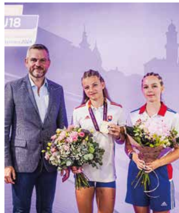
Gratulácia od prezidenta Petra Pellegriniho. Martinským atlétkam venoval kyticu kvetov.

pri štartérovi, sústredil svoju pozornosť okrem štartu aj na prvú prekážku.