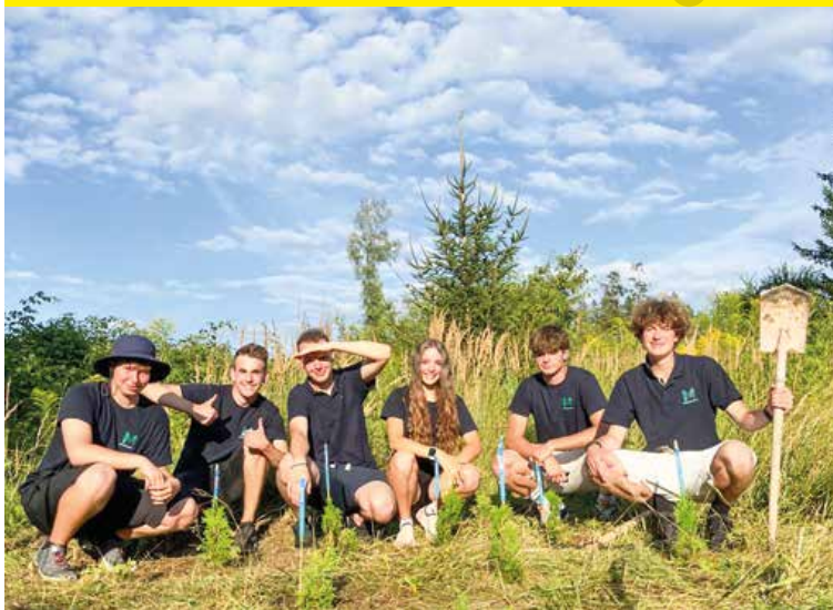
Sadenie stromčekov v Jahodníckych hájoch.

Martinský parlament rozbehol svoju činnosť, mnohé nápady pretavili stredoškólači do konkrétnych a najmä zaujímavých akcií.