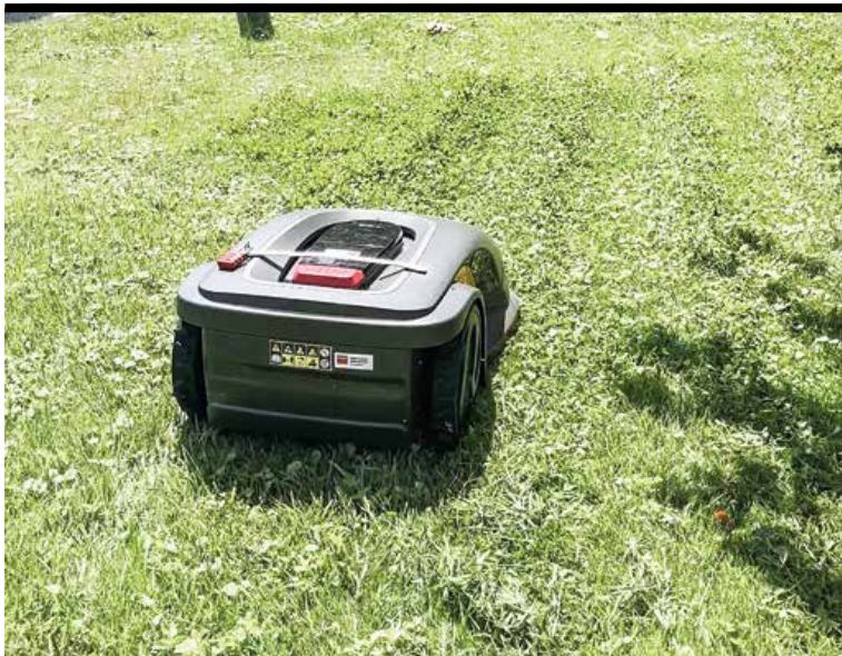
Robotickú kosačku využívajú v centre mesta.