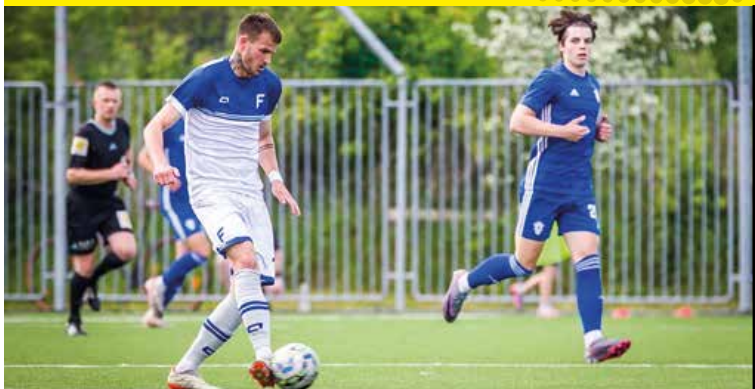
O prvý gól Fomatu v novej sezóne sa postaral Christián Chovanec.