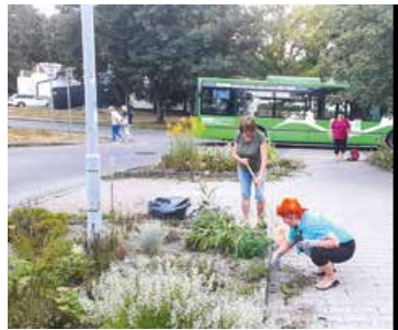
Majka a Gitka z Ľadovne sa pustili do vytrhávania buriny na „námestíčku“ na Ľadovni.

V jeden letný podvečer sme si všimli, že sa na ostrovčeku pracuje.