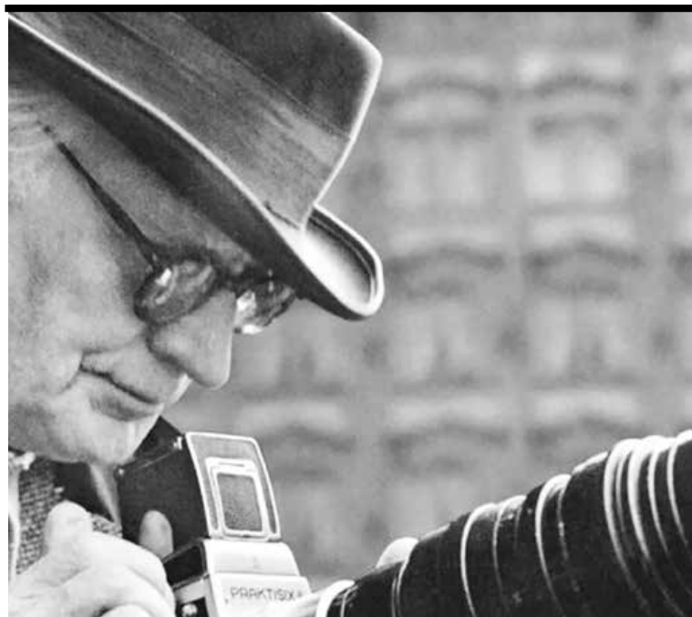
Karel Plicka.

● Benátky pod snehom. Situačná komédia o pozvaní na večeru a zmätení jazykov. Strojár, 10. marca o 19. h. (VL)