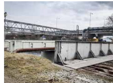
Mosty ponad riekou Turiec, tzv. kamenný a železničný, budú zrenovované do konca mája.