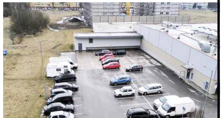
Parkovisko za obchodnou prevádzkou spoločnosti Kaufland.