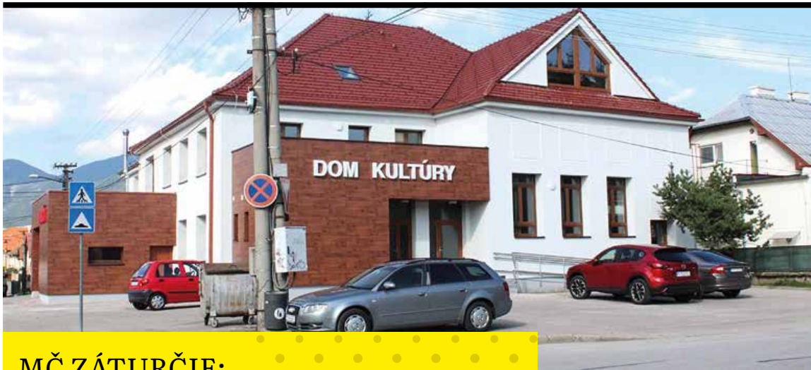
Kulturálny dom v Záturčí.