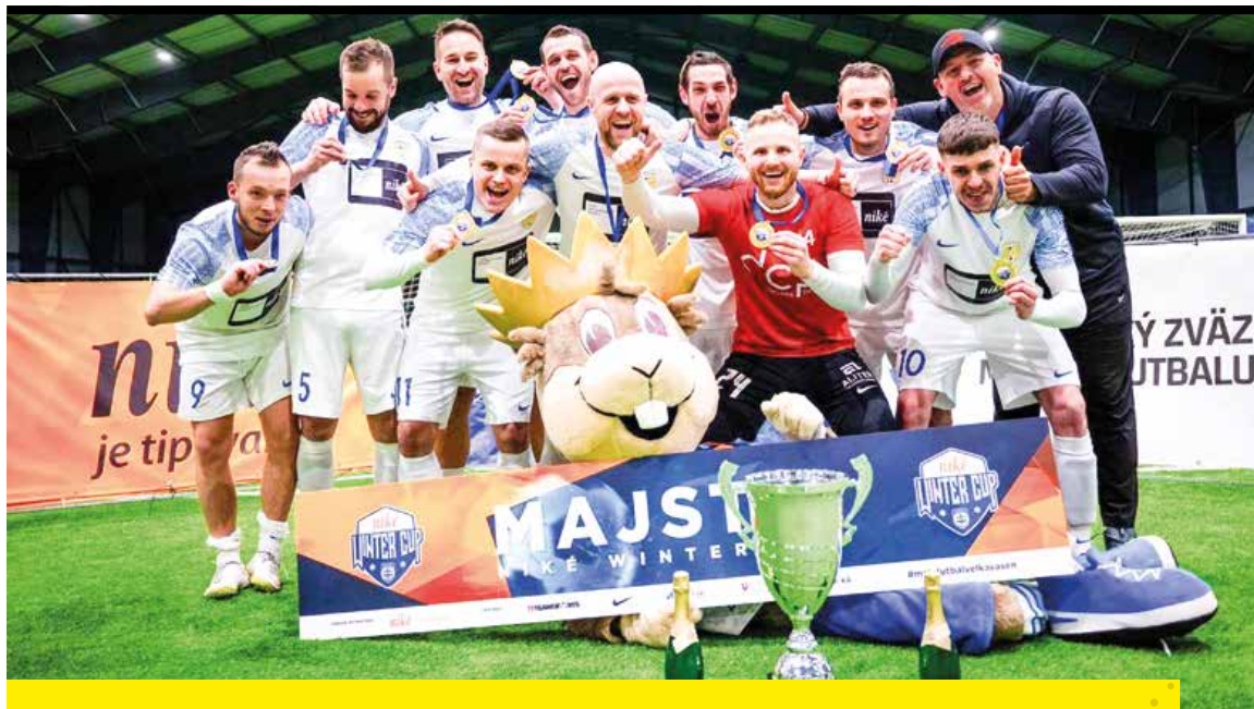
Víťazný tím Zel Degson Martin.