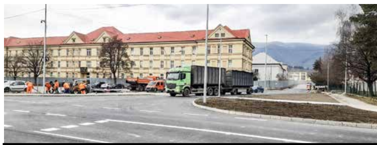
Nový asfaltový koberec dostala aj križovatka ulíc Gorkého a Hrdinov SNP.