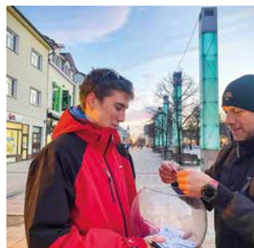
Komplimenty rozdávali aj v centre mesta.

Naši delegáti pri Parlamente mladých Martin zorganizovali na svojich školách podujatia venované tomuto dňu. Žiaci aj učители si vymieňali milé komplimenty a rozdávali pekné odkazy prostredníctvom lístočkov. Taktiež mohli napísať milé slová svojim spolužiakom a učiteľom na špeciálnu tabuľu, čo vytvorilo